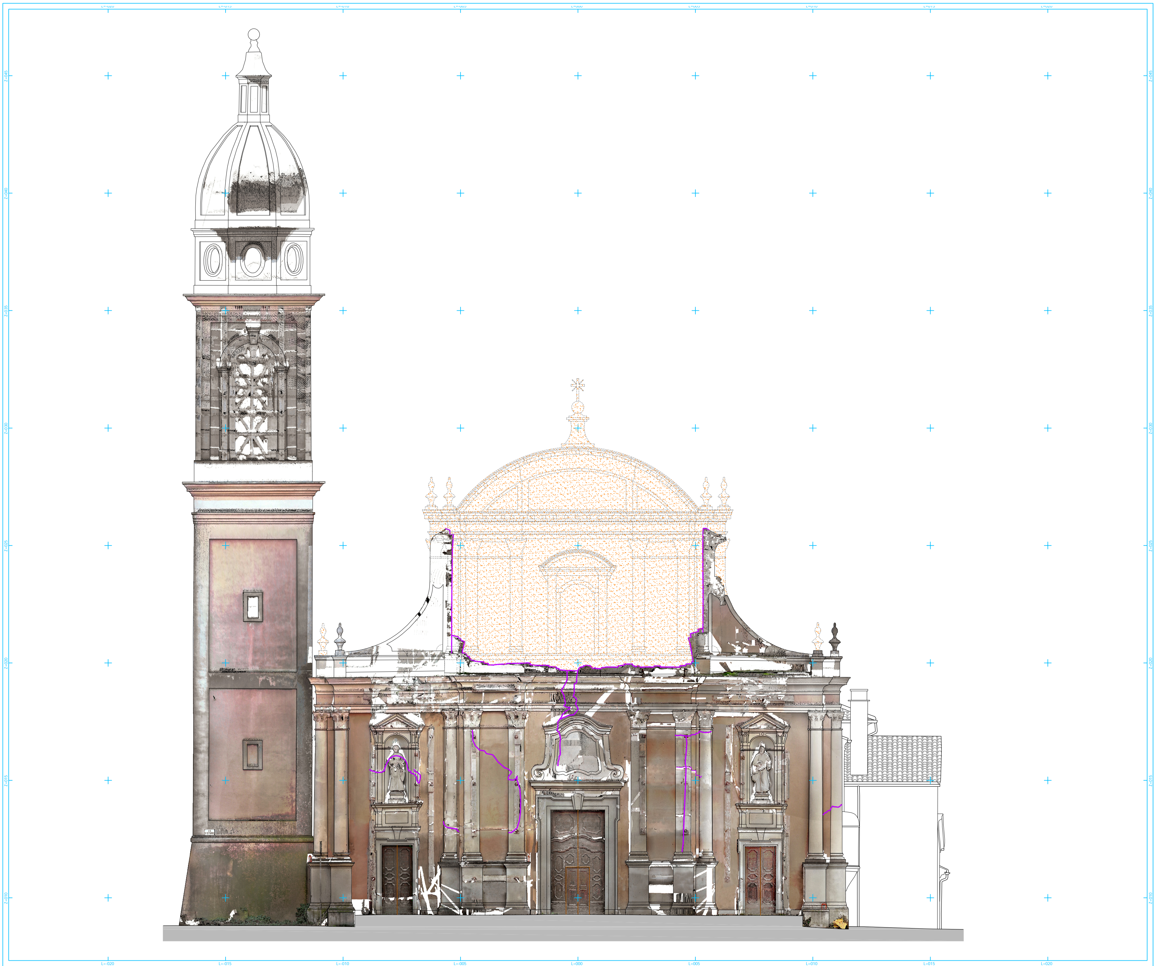
PROSPETTO NORD (FACCIATA)