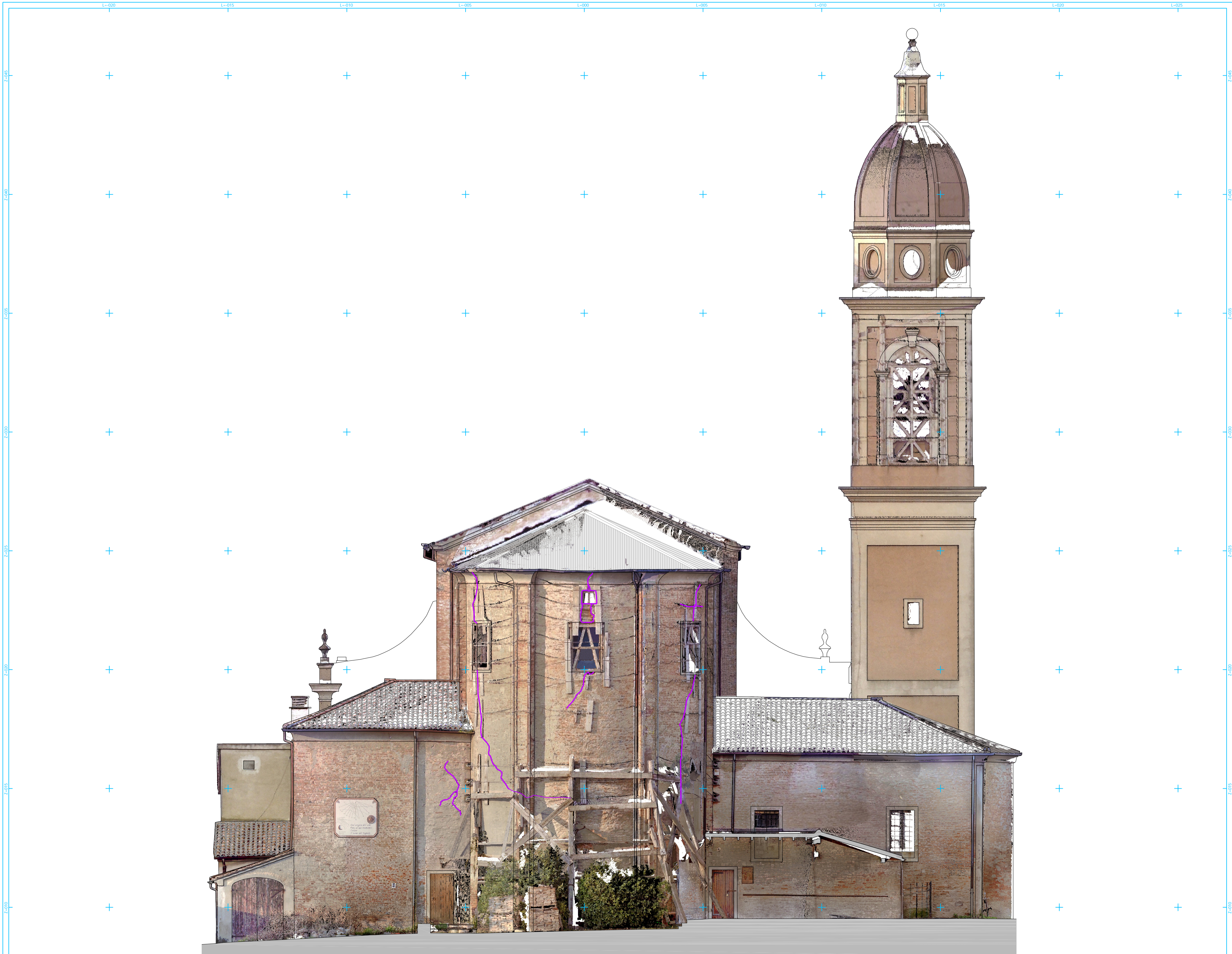
PROSPETTO SUD (ABSIDE)